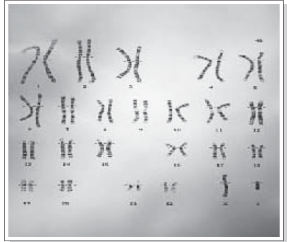
ภาพที่ 1 แสดงโครโมโซมของร่างกายมนุษย์ทั้ง 23 คู่

เนื่องจากโรคธาลัสซีเมียเป็นการแสดงออกแบบพันธุค้อยหมายความว่า ผู้ที่เป็นโรคโลหิตจางธาลัสซีเมีย ต้องมีความผิดปกติของยีนเดียวกันบนทั้ง 2 ข้างของโครโมโซมพร้อมๆกัน ในขณะที่ผู้ที่เป็น