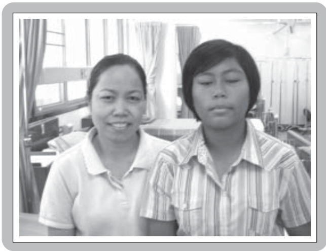
ภาพมารดา(ซ้าย) และผู้ป่วย