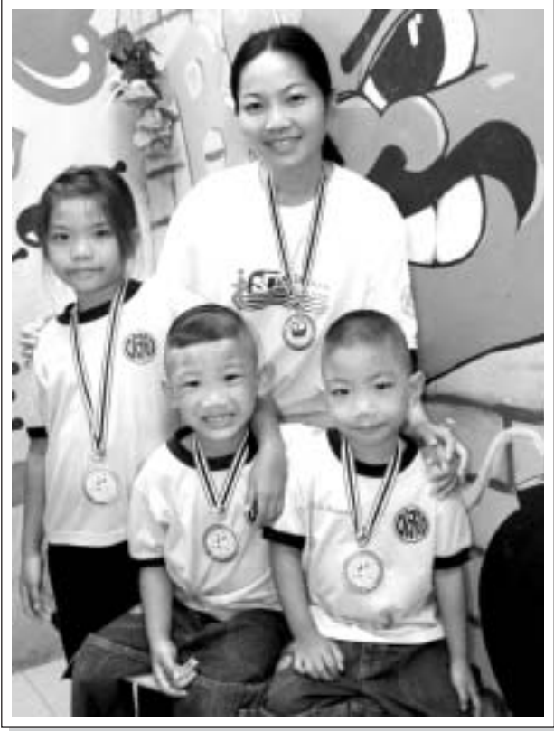
“ พลาสมาที่แข็งแรงเป็นสิ่งซึ่งทุกคนแสวงหา ด้วยรูปแบบที่แตกต่างไม่มีใครจ่ายราคานี้เท่ากันเลย ”

หลังจากที่น้อง Guide ได้รับการวินิจฉัยจากคณะแพทย์ศิริราชพยาบาลว่าเป็นโรคธาลัสซีเมียและจะให้การรักษาโดยการปลูกถ่ายไขกระดูกคุณพ่อ คุณแม่และครอบครัวต่างพากันให้กำลังใจดวงใจน้อย ๆ ดวงนี้ สำหรับคุณแม่เองตลอดระยะเวลาที่ผ่านมาซึ่งมีความหวังกับการปฏิบัติทางการแพทย์ในยุคปัจจุบันว่าจะสามารถทำให้สุขภาพของลูกรักแข็งแรงได้ ก่อนเข้ารับการรักษาด้วยการปลูกถ่ายไขกระดูกนั้น คุณแม่จะระวังและป้องกันภาวะโรคแทรกซ้อนโดยจะถามผลของแพทย์ตลอดว่ามีภาวะซีดแค่ไหน ระวังระวังเรื่องการติดเชื้อ ตรวจเช็คผลแทรกซ้อนต่างๆ ที่อาจเกิดขึ้นได้จากโรคธาลัสซีเมีย เช่น นิวโมเนีย น้ำดี กระดูบบางเปราะ พาไปพบแพทย์ตามนัดสม่ำเสมอเพื่อรับเลือดและรับประทานยาตามคำแนะนำของแพทย์