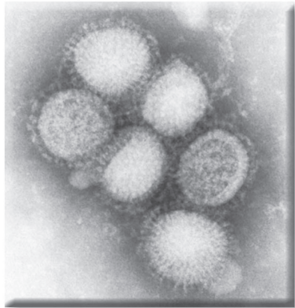
ภาพที่ 1 ไวรัสไข้หวัดใหญ่ เมื่อดูด้วยกล้องจุลทรรศน์อิเล็กตรอน

การเปลี่ยนแปลงตัวเองของไวรัสนี้ หากเป็นการเปลี่ยนแปลงเพียงเล็กน้อยแค่นี้ๆ ก็จะเกิดการระบาดอยู่ในขอบเขตจำกัดและหายไปเมื่อนุชย์สร้างภูมิคุ้มกันต่อต้านได้ เหตุการณ์นี้ศัพท์เฉพาะเรียกว่า “antigenic drift” (“การเคลื่อนไถลของแอนติเจน” – คำนี้ยังไม่มีศัพท์บัญญัติภาษาไทยใช้) ซึ่งเกิดขึ้นได้อยู่เรื่อยๆ ทุก 1-3 ปี แต่บางครั้งไวรัสไข้หวัดใหญ่ก็มีการเปลี่ยนแปลงครั้งใหญ่ชนิดเปลี่ยนทั้งตัว เมื่อเกิดเหตุการณ์แบบนี้ก็จะเกิดการระบาดใหญ่เป็นวงกว้าง อย่างไรก็ตาม เหตุการณ์แบบนี้เกิดไม่บ่อยนัก โดยมักจะห่างกันเป็นสิบๆ ปีขึ้นไป ตัวอย่างในอดีตก็คือไข้หวัดสเปน (Spanish flu) ซึ่งระบาดในปี ค.ศ. 1918-1919 ซึ่งน่าจะเป็นการระบาดของไข้หวัดใหญ่ที่ใหญ่ที่สุดเท่าที่เคยมีการบันทึกมา เชื้อที่ระบาดในครั้งนั้นเป็นเชื้อชนิด เอช 1 เอ็น 1 มีผู้ติดเชื้อประมาณ 20-40% ของประชากรโลกทั้งหมดและมีผู้เสียชีวิตถึงประมาณ 50 ล้านคน (ซึ่งมากกว่าผู้ที่เสียชีวิตจากสงครามโลกครั้งที่ 1 ซึ่งเกิดในช่วงเดียวกันนั้นเสียอีก) ถัดมาคือ Asian Flu ปี 1957, Hong Kong Flu ปี 1968, Swine Flu ปี 1976, Russian Flu ปี 1977, และ Avian Flu ปี 1997 (A/H5N1)